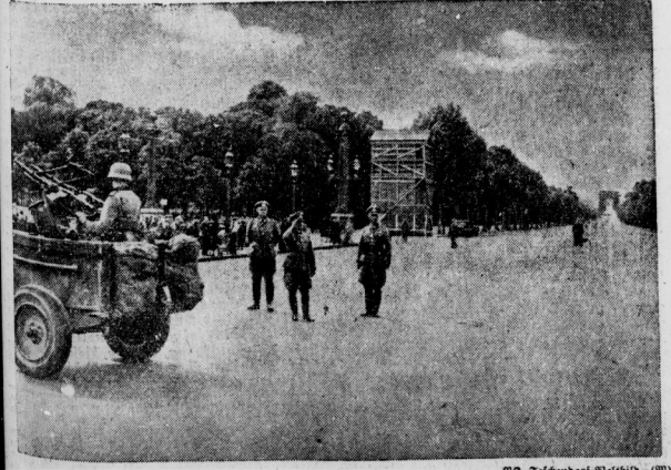
Erstes Bild vom Einzug der deutschen Truppen in Paris, im Hintergrund der Triumphbogen