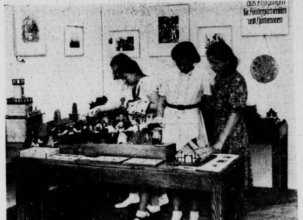
Kindergärtnerinnen und -hortnerinnen steuerten eigene Baselleien zu der Ausstellung bei