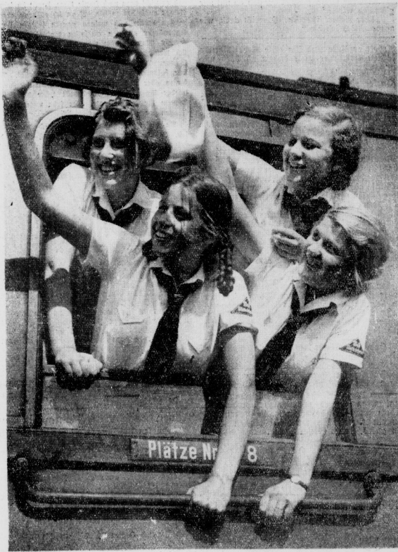
Auf Wäldersehen zur Kartoffelernte! BDM-Mädels fahren vom Ernteeinsatz heim

eine Handarbeit, und die Menschen von heute sind zu ganz dafür. Sie nehmen es über. Nur eines weiß ich jetzt: wenn junge Mädchen fundenlang an einem drei Seiten starken Brief herumlesen, dann muß das ein Liebesbrief sein, und geföhren hat ihn ein Liebhaber. Aber bei solchen Briefen kommt es nicht so sehr auf den Inhalt an, als darauf, daß 'er' überhaupt hat von sich hören lassen. Wenn man nur erst die Uhrzeit hat lesen können, der Rest ist dann mündlich.