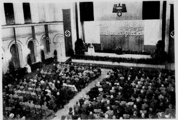
Blick in den Saal des Stadtschützenhauses in Halle, wo Gauleiter Staatsrat Eggeling das 2. Kriegs-Winterhilfswerk für den Gau Halle-Merseburg eröffnete

kommen im Hilfsjahr für das Deutsche Reich betrug im Gau Halle-Merseburg vorläufig 4 710 995,58 RM. Die im vergangenen Jahre 1939/40 im Gau Halle-Merseburg durch die NSB aufgewendeten Leistungen für Kindererholungsstätten, Kinder-Vorbereitung, Müttererholungsstätten und wirtschaftliche Fürsorge machten 2 492 558,51 RM. aus. Dazu kommen noch die Aufwendungen für Bauvorhaben und verschiedene andere Leistungen, die das Bild der sozialen Hilfsbereitschaft unseres Stammganes abrunden.