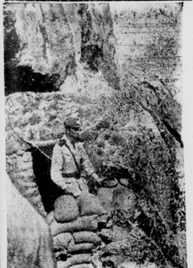
Aufn.: Aerialphoto. Bomben-Flugplatz (A) Italiener im eroberten britischen Feindnest. Ein Offizier der Schwarzhäuten-Division in einer durch Sandsäcke verstärkten britischen Feuerstellung in Ostafrika, die von den Italienern erobert wurde.

Wie immer über die Schweiz kommende feindliche Flieger haben einen schweren Schaden anrichtend. Schäden von geringerer Bedeutung sind an Privatwohnungen verursacht worden. Die beiden oberen Stockwerke eines Wohnhauses in Biel bei Yverdon sind zerstört worden. Ein feindlicher Flugzeug ist beim Start in der Luft abgedroschen worden. Einige Eisenbahnen sind auf dem Bahnhofs in Brand geraten. Weitere Bomben wurden in der Nähe der Stadt auf offenes Feld geworfen, ohne Schaden zu verurteilen.