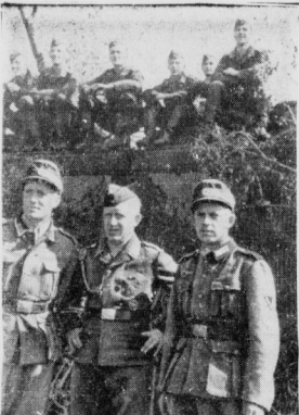
Prominente Zuschauer beim Handballspiel der Nachrichten-Gruppe