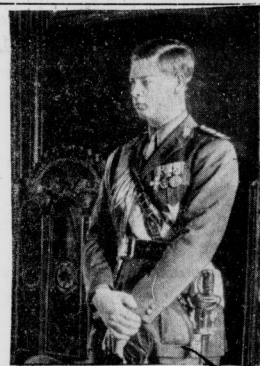
Micha: I. Michael I. König, Kronprinz (R.) Rumänien neuer König

Soldaten! Die Armeen waren immer die ersten, die den Treue für den Thron ablegten. Deshalb haben auch heute, in welcher Lage immer sich die Truppen befinden sollten, alle bis 18 Uhr patrouillierend auf den neuen König den Treue zu leisten. Die Durchführung des Befehls ist sofort zu meiden.