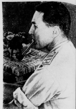
Prof. Dr. Herzog von Aosta der Vizekönig von Abyssinien und Oberkommandierende der siegreichen Somali-Armee während einer Ruhepause nach dem Kampfe

Unterdessen war die französische Bevölkerung von Nord und fern herbeigekommen, um ihre Vorräte und Keller aus den Vorräten des Lagers zu füllen. Mit allen erdenklichen Beförderungsmitteln sind tagelang große Mengen geprüdeltes Gutes aus diesem Lager weggeschafft worden, im ganzen aber war es doch nur ein verschwindend geringer Bruchteil der riesigen Bestände, die völlig unverletzt in die deutsche Hand fielen. Zum Schluß hat dieser ein Mann mit einer Pistole das Lager verteidigt. Er legte sich hinter eine Mauer, schob Scher in die Luft und rief immer wieder nur den einen Satz: „Die Deutschen kommen!“ Am nächsten Morgen waren sie wirklich da. Zwei fast zwei Monaten werden nun mehrere deutsche Divisionen aus diesem Lager vertriebt. Die Bestände sind noch nicht zu Ende gegangen, es ist immer noch genug da, und es wird noch ein großer Bestand an Lebensmitteln der letzten britischen Beuteführer in deutschen