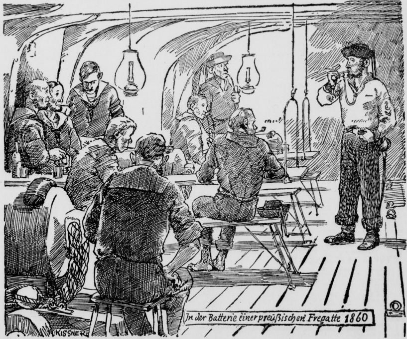
In der Batterie einer preussischen Fregatte 1860

„Pfeifen und Lunten aus!“ Ein Kommando, das eigens für den Seemann geschaffen wurde, und das erkennen läßt, wie gerne er schon immer rauchte. Wenn wir ihm heute Zigaretten anbieten, sollen sie ihm besonders gut schmecken; so gut sogar, daß es ihm schwer fällt, wenn er sie unverhofft ausmachen muß.