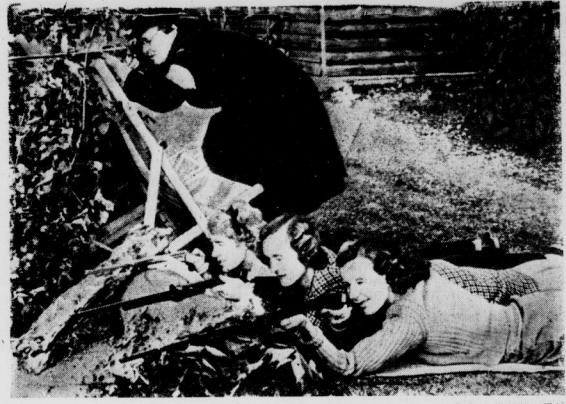
Die sollen England schützen! Noch immer macht England mit solchen Aufnahmen Reklame für den Heckenackerkrieg. Ob die plukokratischen Machthaber, die diese Frauenkorps zur Bekämpfung der deutschen Fallschirmjäger ausbilden, wirklich glauben, daß diese armen Wesen mit ihren Schießleisen etwas gegen die modernste Armee der Welt ausrichten können?