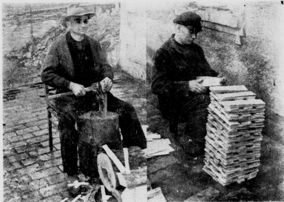
Links: Von den Holzloben muß die Rinde entfernt werden. Rechts: In solch kleinen Häutchen werden die Splitte gestapelt

Ein Splitt ist ein dünnes Holz Brettchen, das unter die Dachziegel gelegt wird. Man isart dabei das leichtere und schwere Doppelband und verhilft sich bei gleicher Lebensdauer zu einer leichteren und damit billigeren Dachkonstruktion.