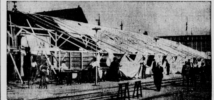
Die neue vorläufige Ausstellungshalle für die vernichtete Halle IV. Die Aufräumungsarbeiten auf der Berliner Funkausstellung wurden mit größter Schnelligkeit durchgeführt. Gestern morgen bereits entstand diese neue vorläufige Halle für die Industriearbeiter, die bisher in der Halle IV ausstellten.

Mit der Freiheit, neben- und vitaminarmen Völkerbundssoß geht es endlich zu Ende, es gibt eine mannhafte, würdige Ab-