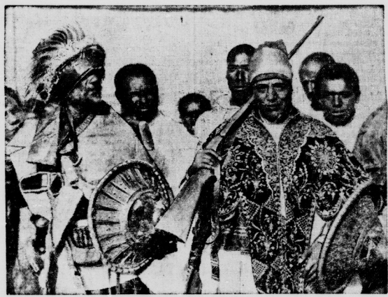
Ein Ras versammelt seine Krieger. Selbstbildnis.

„Vorans auch zweifelslos Ydu rasch Unfähigkeit, sich auf dem Thron zu behaupten, erklärt werden kann“, sagte mein Sekretär mit leiser Stimme hinzu.“