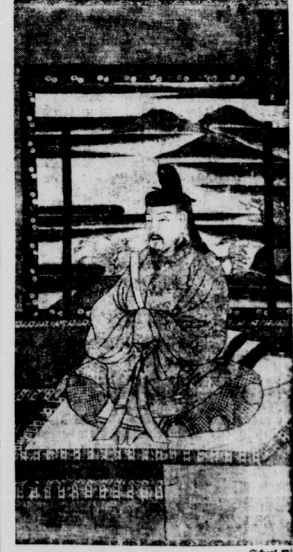
Das Geschenk des Führers für Japans Kaiser, das berühmte Kaiser-Saga-Bild.

Heute meldet aus Genf, Eden und Laval hatten gestern eine lange Besprechung mit den Vertretern Litauens und Lettlands, Zogoraitis und Munter, über die Frage der Zukunft von Memel. Es verlanget, die vier Staatsmänner seien übereingekommen, die Frage auf diplomatischem Wege und nicht vor dem Völkerbundsrat oder der Völkerbundsversammlung zu behandeln.