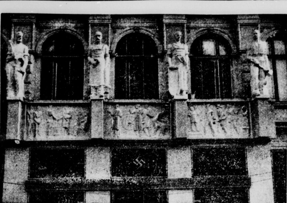
Steinbilder schaffender Menschen schmücken das „Haus des Deutschen Handwerks“.

Geringer Anstieg der Arbeitslosenzahl / Guter Beschäftigungsgrad