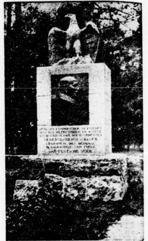
Lehrer im Frieden / Heerführer im Kriege. Auf Anordnung des Führers wurde an der letzten Ruhestätte des Generalobersten v. Kluck auf dem Stahnsdorfer Waldfriedhof bei Berlin dieser Denkstein enthüllt.