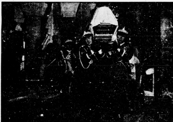
Polnische Generale, an der Spitze der Generalinspekteur der Wehrmacht, General Rydz-Smigly, und der Kriegsminister, General Kasprzycki, trugen den Sarg in die Krypta, wo der Gründer des neuen polnischen Staates zum ewigen Schlaf gebettet wurde.