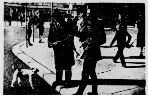
„Foxel“ lauscht der Instruktion stande für Herrchen.