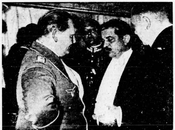
General Göring im Gespräch mit Außenminister Laval in Krakau.