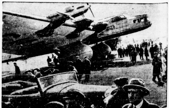
Sowjetrußlands Luftreise „Maxim Gorki“, der abgestürzt ist.