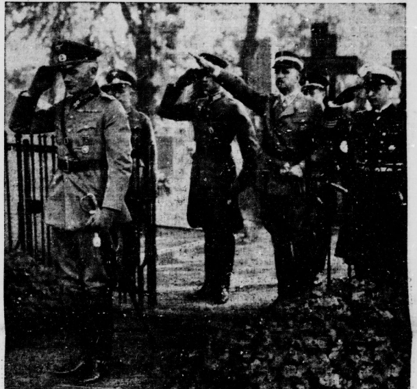
Reichskriegsminister v. Blomberg eilt dem Mitschöpfer der deutschen Wehrmacht. Am Tage nach der historischen Reichstagsrede des Führers und der Verkündung des Wehrgesetzes legte Reichskriegsminister Generaloberst v. Blomberg am Grabe des Generals Scharnhorst, des Schöpfers des Volksheres, und am Grabe des Generalfeldmarschalls v. Boyen, der im Jahre 1814 die allgemeine Wehrpflicht in Preußen einführt, Kranze nieder. Unser Bild zeigt den Reichskriegsminister nach der Kranzniederlegung auf dem Invalidenfriedhof vor dem Grabe Boyens; dahinter Reichserziehungsminister Rust und Offiziere der Wehrmacht.

mit klarer Vereinfachtheit die Wermerlichkeit des Luftkrieges zu verurteilen. Der erste Schritt in dieser Beziehung gehe über dahin, durch Verhandlungen das „Locarno“ aufzulesen. Times schließt: Inzwischen ist die Aussicht auf Krieg infolge der Erklärung der britischen Regierung und der Rede Sitters vom Vortage endgültig zurückgegangen. Beide Regierungen haben bemerkenswerte Beiträge zu dem Vertrauen gegeben, das das Hauptbedürfnis Europas ist. Endlich gibt es eine Grundlage für eine praktische Regelung. In Besprechung der Baldwin-Rede im Unterhaus führt „Daily Herald“ Klage darüber, daß die Regierung die Verdreifachung der britischen Luftstreitmacht beschließen habe, wenn, als ob Hitler kein Angebot gemacht hätte. Wahrscheinlich würden britische Schritte in Berlin erfolgen, um die genaue Bedeutung der Hitler-Rede kennenzulernen. Im Leitartikel des „New Chronicle“ heißt es u. a.: Hitler habe allen Grund, mit der Aufnahme seiner Rede in England zufrieden zu sein.