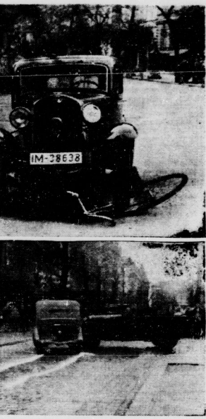
Verschiedene Zusammenstöße, vom Unfallkommando aufgenommen. Auf zwei Bildern erkennt man die weiß nachgezogenen Bremsenspuren.

zweifellos hoher Geschwindigkeit in Richtung Ammendorf. Als er gerade einen Kurvenabschnitt überquerte und sich mitten auf der Fahrbahn befand, überquerete plötzlich ein Anhänger der Landstraße. Weisse versuchte seine Maschine noch schnell zur Seite zu weichen, fuhr aber doch gegen den Anhänger, der zu Boden stürzte und sich schwer verletzte.