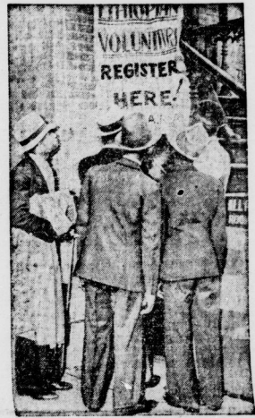
Werbestelle für abessinische Freiwillige in New York.

Davispokalskampf 4:1 verloren. Der Davispokals-Interkontinentalkampf zwischen Deutschland und Amerika in Wimbledon hat mit dem Siege der Amerikaner geendet, die im Gesamtergebnis 4:1 gewonnen. Im ersten Kampf des Schlußtages hat bereits die Entscheidung zugunsten Amerikas, da Wilson den unter seiner Bestform spielenden Henkel 6:1, 7:5, 11:9 schlug. Eine überraschende Niederlage erlitt dann Fejt. In einem im abschließenden Treffen gegen Fudge. Der hart angreifende Amerikaner siegte 6:5, 9:7, 8:6, 6:3. Amerika tritt nun am 27., 29. und 30. Juli in der Davis-Interkontinentalkampf gegen England an. Ausführlicher Bericht im Sportteil.