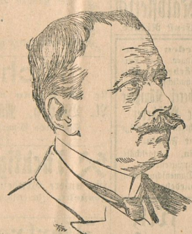
Gen. Legationsrat Dr. Seitz wurde zum Gouverneur von Deutsch-Südwestafrika ernannt.