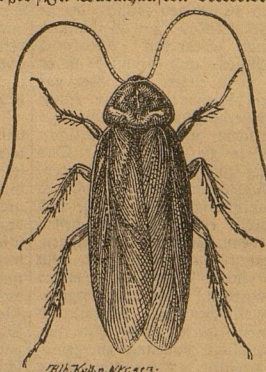
Abbildung 3. Amerikanische Schabe.

in einer Kapsel eingeschlossen, welche die Form einer Bohne und eine glänzend schwarzbraune Oberfläche hat. Die Kapsel ragt tagelang aus der Leibespitze vor, rückt nach und nach weiter heraus, bis sie schließlich in irgend einem Schlupfwinkel fallen gelassen wird.