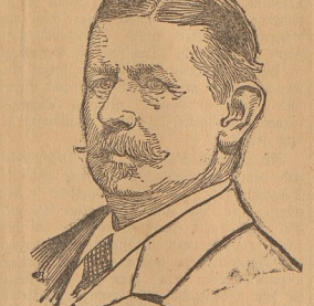
Sydow, der neue preuss. Handelsminister.

ert getregelt und dann auf der Stelle duelliert. Beide Offiziere wurden vom Kriegserichter freigesprochen.