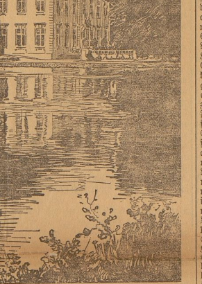
Die Dammühle des Kaisers, die im Jahre 1872 erbaut wurde.

Dammühle, das neue Jagdschloß des Kaisers.