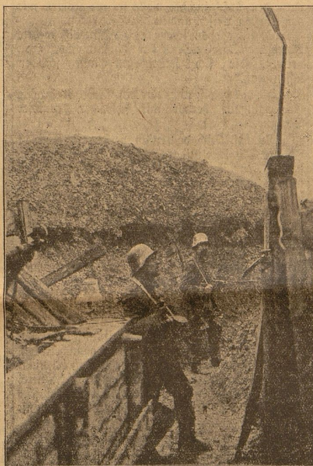
Posten am Gelände-Spiegel und Grabenpatrouille.

„Nebenfalls bringt es mehr Dornen als Rosen.“