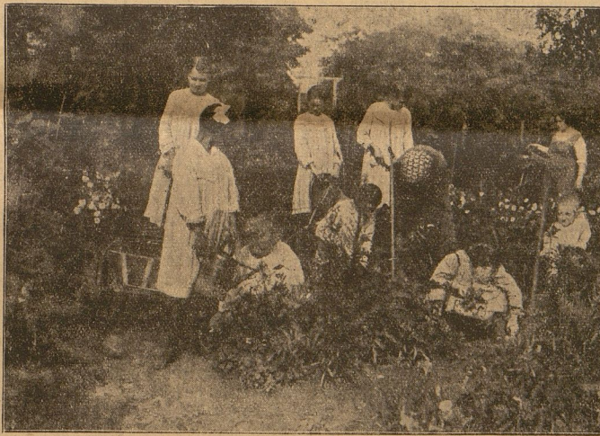
In den Lehrgärten des Bundes Deutscher Pfadfinderinnen

„Ach, Du wirst schon ein Winkelfeld für mich haben. Ich will ganz bescheiden sein, wenn ich nur bei Dir bleiben kann.“