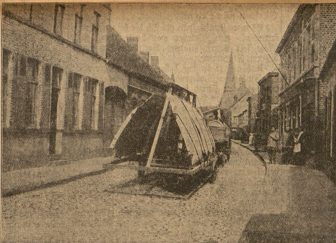
Flugzeugtransport durch eine flandrische Ortschaft.

Günters scharfgeschnittenes, charakteristisches Gesicht wurde grell von der Lampe beleuchtet, die mit gelben Perlenbehängen und einem goldfarbigen Seidenschirm neben ihnen auf einem Tischchen mit eingelegerter kunstvoller Platte aus Ebenholz und Elfenbein stand. Wie helle Bronze wirkten die energischen, festgefügtten Züge. Kein Bart bedeckte das markante Kinn und den schmallippigen Mund. Seltfam hell und klar leuchteten die tiefstehenden grauen Augen aus diesem gebräunten Gesicht. Sie leuchteten in frohem Bewußtsein, seinem Wohltäter einen guten Rat geben zu können. Langsam strich er mit der schlanken festen Hand über das dunkle, gescheitelte Haar.