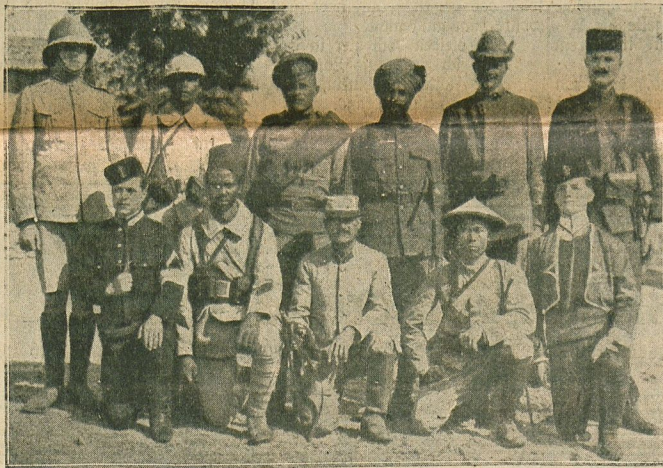
Typen des Völkhercees der Ententetruppen in Saloniki.

Frau von Rehling erwog in aller Eile, welche Vorreile sie noch aus der durchaus nicht beneidenswerten Lage herauszuschlagen konnte. Eines mußte sie nun wenigstens, daß Sanna für sie