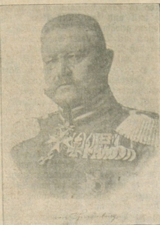
Bildgröße 28x38 cm Kartongröße 45x60 cm

Rilfschees in Autotypie und Strich Wilhelm Creve, Berlin SW68, Ritterstr. 50.