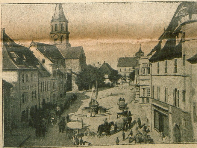
Eine Bagagekolonne passiert den Mackplatz von Sutz.

immer aufgehenden Sonne, die seit geraumer Zeit nicht um einen Zoll höher gegangen war am Horizont.