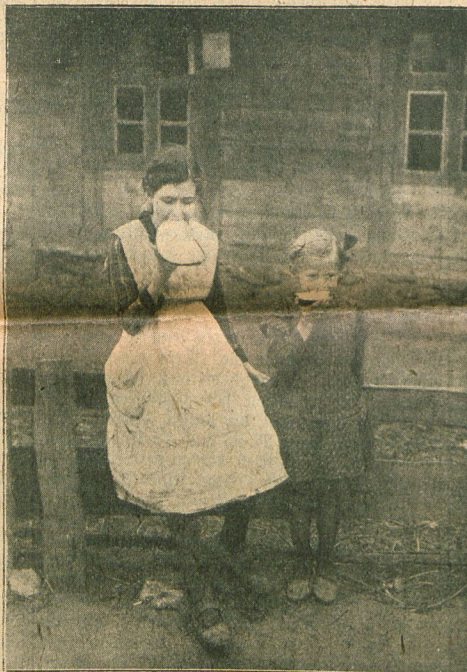
Ein Stimmungsbild: Die langeschnehte Butterstraße.