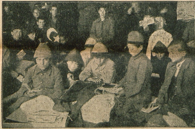
Türkische Jugend in Berlin.