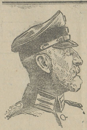
General der Infanterie Graf Helm von Bothmer.

werden, wo es vor dem Kriege unterbrochen werden ist. Alle Strafe der Nation müssen den wahren Interessen der Nation dienen.