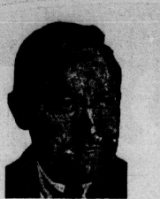
Genosse Wajschm, Mitglied des Staatsgerichtshofes.