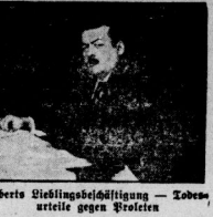
Über die Lieblingseinstellung — Lobesurteile gegen Streiter