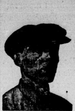
Rjfeljo, Arbeiter des Moskauer Dynamit-Fabrik, Kalm-Schäger.