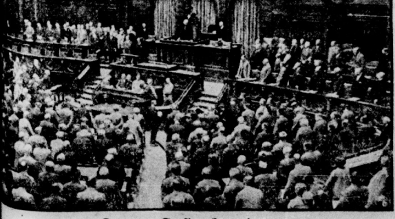
Das neue Trustparlament der Deutschen Geldmarkrepublik, der Reichstag wurde eröffnet. Vor der Eröffnung, die unser Bild zeigt, gingen die bürgerlichen Abgeordneten erst einmal zur Kirche

Die gegenseitige Fernsprecherbindung zwischen Deutschland und Argentinien wird auf etwa 15 Meter kurzen Wellen mit einer Sendeenergie von etwa 20 Kilowatt geführt. Neuartige Strahlenerweiterungen und Einrichtungen zur Beschleunigung der periodischen Verbindungen nitrendes erreichte Gleichmäßigkeit und Querschnittzeit der Gespräche bewirkt. Die Verbindung gina von Berlin über Kauen nach der Empfangsstation Villa Elisa und von der Sende-Station Monte Grande — beide in der Umgegend von Buenos Aires liegend — zurück nach Goltom bei Potsdam. Die Gesprächsteilnehmer in Buenos Aires befanden sich im Szenen der Stadt in den Räumen der Betriebszentrale der argentinischen Gesellschaft „Transradio International“, die durch gewöhnliche Drahtverbindungen mit der Sende- und Empfangsstation verbunden war. Ebenso führten von hier gewöhnliche Drahtverbindungen (Abfertigungen) nach der Transradio Argentinische Gesellschaft (Abfertiger) gehörenden Stationen Kauen und Goltom bei Potsdam. In dieser Demonstration werden unsere Schiller ein ganz besonderes Interesse haben, wenn sie bedenken, welche Schwierigkeiten sie durch atmosphärische Störungen und Geräusche, durch Fading und anderes schon bei einigen hundert Kilometern Entfernung oftmals haben.