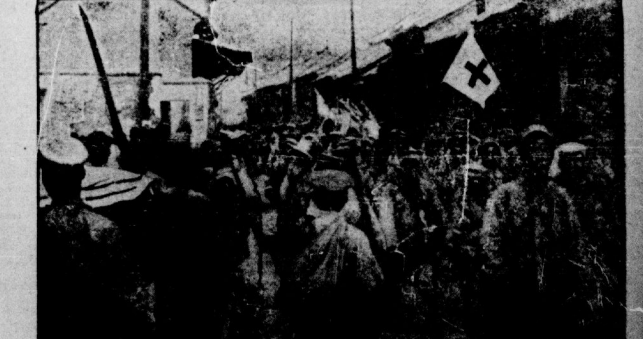
Vom chinesischen Kriegsschauplatz Einmarsch der nationalchinesischen Söldtruppen in das heimgelämpfte Tientsin