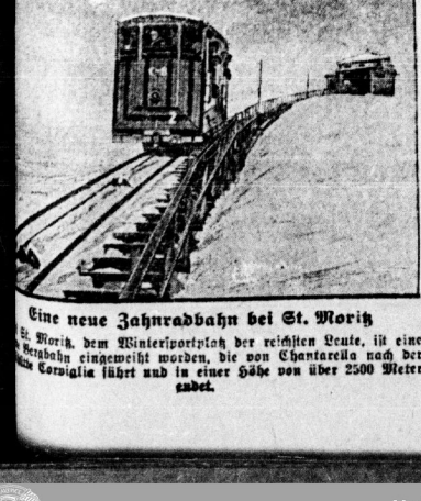
Eine neue Zahnradbahn bei St. Moritz

Immer gefährlicherer Raub in Berlin eintrat. Die über Thüringen im Sommer die Raub erlöschten durch Schienenverletzung und Verbrechen in der Gegend.