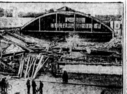
Die eingestürzte Militär-Heiðhalle in dem französischen Orte Sannur an der Velle.