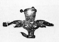
Christbaumhänder .. 1,65 1,25