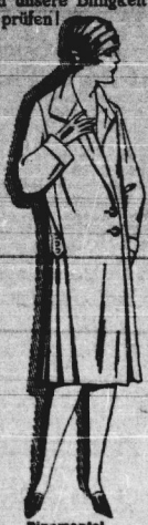
Regenmantel It. Bild, modern und reichlich gearbeitet, aus reinwilligen Ripps mit netzlic. Faltenverzierung 26,50

biten wir, uns zwanglos zu besuchen und unsere Billigkeit zu prüfen!