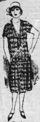
Fisches Moussekleid It. Bild, mit modernem Faltenrock 8,90