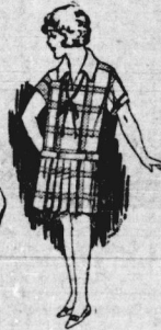
Hinderkleidchen It. Bild, aus guten Schottenstoffen, Größe 60 4,50