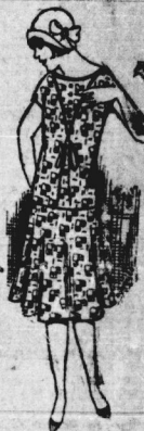
Moussekleid It. Bild, mit weitem Glockenrock 9,50