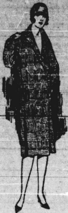
Mantel It. Bild, aus modern gewaserten Stoffen 11,50