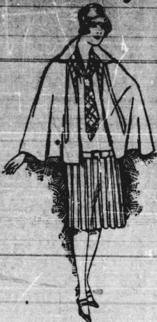
Das Cape-Complet It. Bild, die vornehme Kleidung, herrlichste Farben, mit weißen Plissé-Rock 29,75