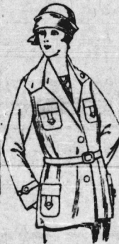
Windjacke It. Bild, aus gutem, imprägniertem Stoff 8,90