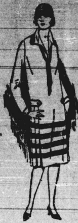
Bordürenkleid It. Bild, mit modernem Faltenrock u. einfarbiger Krawatte 19,50