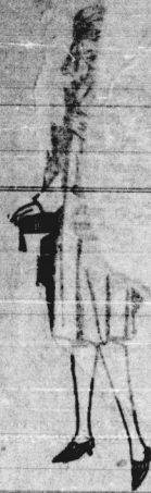
Covercoat-Mantel It. Bild, modernem Glockenform 8,50