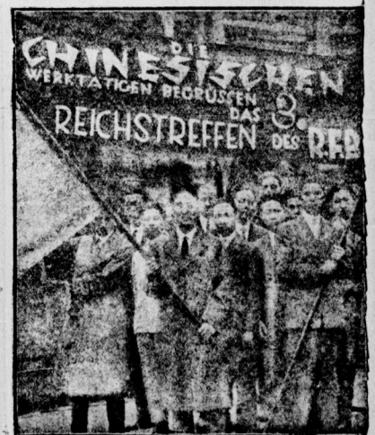
Die chinesische Delegation