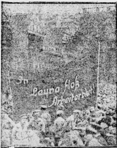
Links: KZ-Zug aus Halle- Merseburg