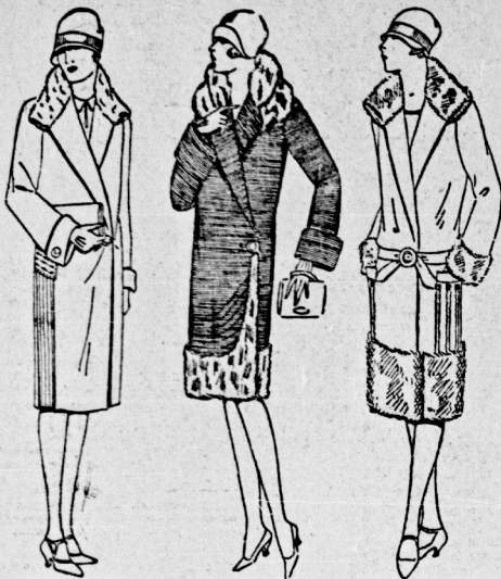
Flausch-Mantel aus gutem weichen Wintermohr mit Pelzbesatz 16,75 Flausch-Mantel aus gutem weichen Wintermohr mit Pelzbesatz 19,75 Ottomane-Mantel aus gutem weichen Wintermohr mit Pelzbesatz 39,50