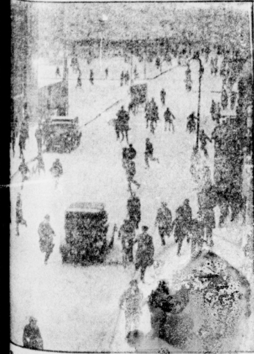
Polizeiattake vor dem Karl-Liebknecht-Haus Polizeibehörden zerschlagen die Demonstration.