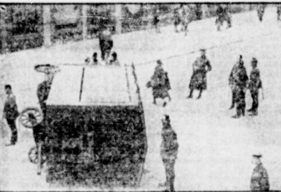
Schlag- und schafffertig sammelt sich die Schupo hinter einem umgelärteten Wagen.

„Zu danken haben bin ich in der letzten Zeit und besonders, nachdem Hamburg, Kiel und München ihre Demonstrationserbote aufgehoben haben, gefragt worden, warum nicht auch ich das Demonstrationserbot für Berlin aufhebe. . . Hätte ich vor diesem Gelächter und diesen Gewalttaten den Mützig angetreten, so wäre das geradezu ein Signal gewesen für eine weitere Untergrabung der Staatsautorität und Terrorisierung der staatsstreuen Mitbürger.“