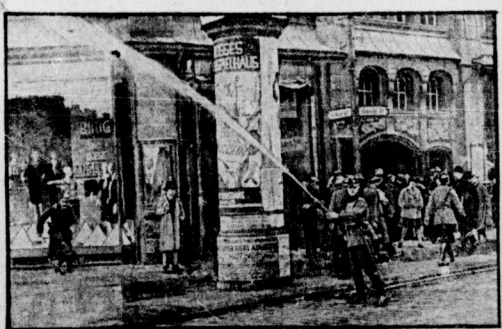
von Berlin: Frauen, Mädchen und Kinder, werden durch die Straßen gejagt — Mit der Wasserpritze gegen friedliche Demonstranten