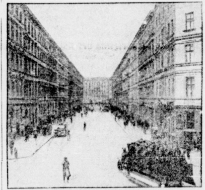
Nach getauer Brügelarbeit sprangen Jürgiebels „Helben“ wieder auf die Autos und suchten sich ein neues Schlachtfeld.

Im Karl-Liebknecht-Haus kam es in den Mittagsstunden zu heftigen Zusammenstößen mit der Polizei. Es wurden mehrere hundert Arbeiter verhaftet, um friedlich zu demonstrieren. Mit erschöpferten Revolvern und Gummistempeln schlugen die Polizeibeamten von den Lastautos auf die Menge. Die Polizei wurde abgerufen. Bald aber war es wiederum zum Zusammenstoß gekommen. Die Polizei zog Berückung heran. Sie hatten die Arbeiter am Ausgang der Kleinen Friedrichstraße eine Barrikade aus Wagenbreitern und Metalltüren errichtet. Als sich im Hause Kleine Friedrichstraße im 4. Stock zwei kleine Kinder am Fenster zeigten, schrie die Polizei das Feuer auf diese Kinder. Der Karl-Liebknecht-Haus wurde ununterbrochen in die Luft der Räume der Druckerei geschossen. Hebrall