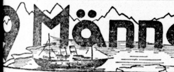
Kümmerte einer Polartragödie