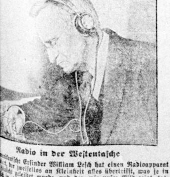
Radio in der Westentasche

Ein falkischer Arzt als Heiratsschindler festgenommen. Ein falkischer Arzt wurde als Heiratsschindler festgenommen. Er hatte sich in mehreren Fällen als Heiratsschindler betätigt.