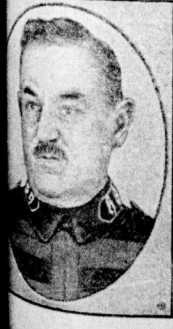
Das Heil der deutschen Arbeiterarmee

Ein Buch, in welchem der herrliche Alltag des sozialistischen Lebens herzerotiert und worin von der Erziehung verwohnter Jugendlicher geschrieben wird, kann gefasst werden in der Volksbuchhandlung GmbH, Halle a. S., Lerchenfeldstraße 14 und in deren Filialen.