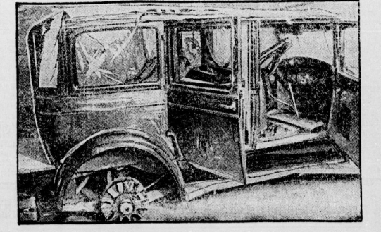
Unter der Bilders zeigen das Unfallauto und einen der Insassen, Theodor Leipzig, den Oberpräsidenten des Wirtschaftsvereins.