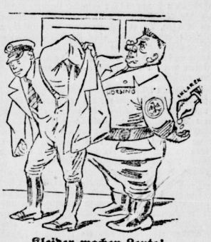
Reider machen Leute! Söhnchen: „So mein Junge, mit der Starets-Tade immer selte gehen die Kommunisten. Der Bundesvorstand bemerkt Pfaffen!“ Sensationselle Enthüllungen darüber heute auf Seite 3.

In Eberswalde veranstalteten am Sonntag die Hitler-Garden eine Kundgebung. Die Hitler-Garden provozieren Zusammenstöße mit den Arbeitern von Eberswalde. Die Polizei verhaftete mehrere Arbeiter. Die Patentreuzler ließ sie bis auf einen laufen, dessen Verhaftung sich nicht vermeiden ließ.