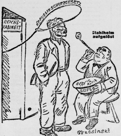
Arbeiter, Achtung! Seifenblasen! Man will Euch fangen!

Sabis Wlad soll nach einer Meldung des „Daily Telegraph“, aus Sabis-Hafen entfangen worden und in der Zitadelle von Kabin festgesetzt worden sein.