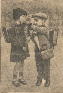
Die sich gleich am ersten Tage gefunden haben.

Wernigeröde, 31. März. Der erste Schultag.