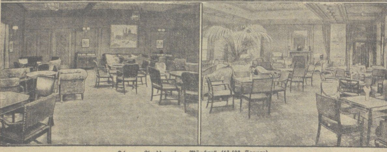
Oben: Dampfer „München“ (13 483 Tonnen).