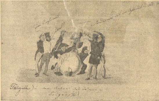
Skizzen auf den Wiener Kongress (1815).