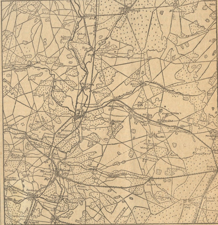
Das Gebiet des „Wehrwolfromans“ und die Stätte des Wehrwolfhubs zu Pfingsten.