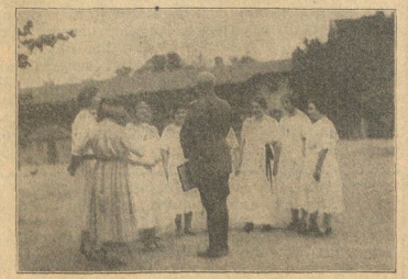
Ludendorff empfängt die Opfergruppe des Wehrwölf.

Dann ordneten sich die Festteilnehmer und die Fahnen wurden in 60 Vorkraftwagen nach dem Festplatz überführt. Aber auch noch viele mußten zu Fuß marschieren, so die prächtige Fahnengruppe des Wehrwölf, überall mit stürmischen Beifall begrüßt. Ein Fittger freute über der Stadt und wart am Denkmal einen Kranz ab. Angewiesen begaben sich ein großer Teil der Ehrengäste zum Essen in Stadt Hamburg, während auf dem Festplatz die Aufstellung erfolgte.