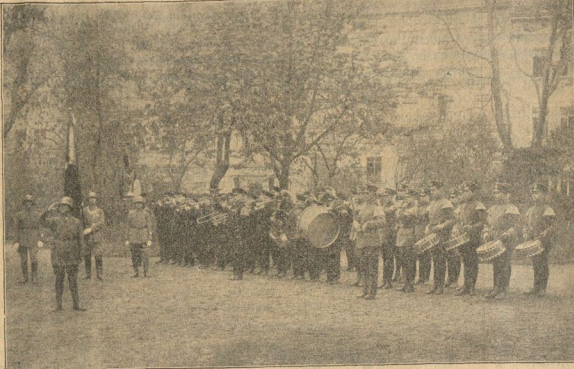
Der Spielmannszug Halle mit der Bergkapelle.