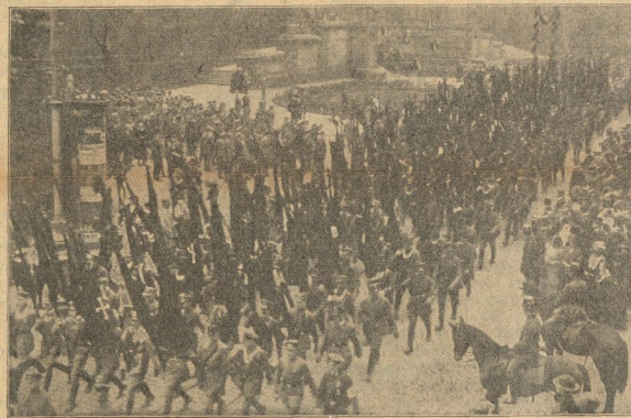
Die Wehrwölfmarch beim Umarmen vom Denkmal.

Ich danke Ihnen für den warmen Empfang von heute