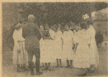
Ludendorff empfängt die Opfergruppe des Wehrwölf.