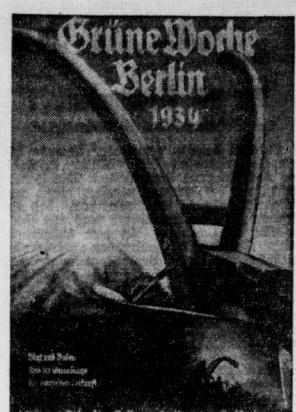
Farbige Plakate weisen auf die große Schau der ...