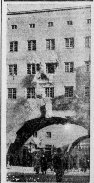
Da: Tor des Karl-Marx-Hofes.

Aus der Ferne gesehen wird es vielen unverständlich erscheinen, daß die Machtmittel des österreichischen Staates, das Artillerie, Minenwerfer, Maschinengewehre, Flammenwerfer und was dergleichen moderne Ausrüstungsmittel mehr sind, immerhin recht lange Zeit benötigten, ehe die roten Hochburgen Wiens besonnen werden konnten. Man muß aber wissen, daß die marxistische Stadterhaltung von Wien viele tote Massenquartiere — moderne Wohnblöcke mit allen Schikanen — als Sicherung ihrer Herrschaft benutzt; an strategischen Stellen und unter strategischen Gesichtspunkten erbaut hat. Jede dieser riesigen Wohnkomplexe hat nur einen einzigen großen Treppengang, der schon beim Bau unter dem Gesichtspunkt gesundheitlicher Verteidigung mit Maschinenmassen versehen war. Bei diesen Treppengängen liegen betonierte Abgräben, die ebenfalls von den Erbauern für kommende Fälle als Verteidigungsmittel errichtet worden. Die nach außen liegenden Fenster hatten schon von Anfang an Stahlblenden besom-