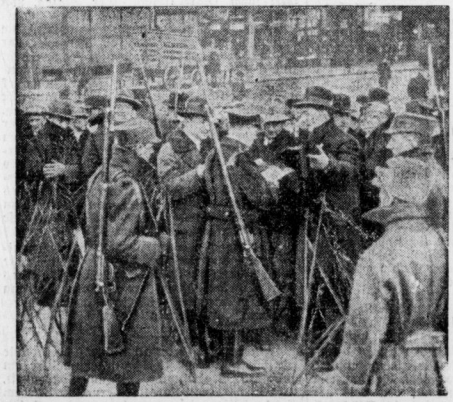
Polizei- und Heimwehrmänner überwachen die Drahtverhau.

Im Lande Oesterreich ist die Lage nach wie vor sehr ernst. In der Stadt Steyr sind die Aufständischen immer noch Herr der Stadt, nachdem sie lediglich einen Teil der Stadt nach heftigem Artilleriefeuer räumen