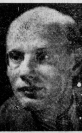
Gustaf Gründgens, der neue Leiter des Berliner Staatsbühnen.