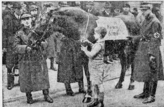
Nach den SA-Führern sammelten die SA-Männer. Ein Bild der Berliner Sammelaktion für bedürftige SA-Kameraden; das Pferd, das die Männer eines SA-Reitertrupps begleitete, wird mit einem Schild: 'Ich kann biten!'

Die wissenschaftlich belegten Methoden der Propaganda um jeden Preis haben naturgemäß bewirkt, daß bei Gehaltung vor allem der neuen Methoden auch neue Ideen zur Anwendung gebracht werden sind. Hier sind Methoden verwendet worden, von denen auch andere Völker noch lernen können. Der Hauptfehler der Propaganda scheint aber in einer Heberpropaganda zu liegen, die es dann mit der Wahrheit nicht sehr genau nimmt. So ist mir in einem Museum für Säuglingspflege erklärt worden, daß heute in Russland zwei Millionen Kindersterben vorhanden seien, und daß die Säuglingssterblichkeit gerade in der Arbeiterklasse von