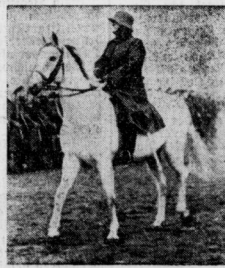
Schutzkorps-Parade in Wien. Vizekanzler Fey führte das Schutzkorps der Regierung vor.