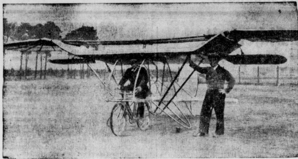
Jeder sein eigenes Flugzeug mit dem fliegenden Fahrrad.

Ein neues Schwingenflugzeug eines Berliner Konstrukteurs.