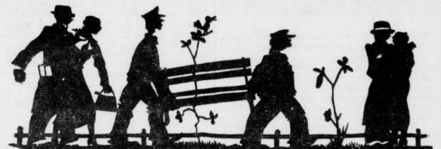
Frühling im Stadtpark Ehrenskulptur von B. Tenius

„Sag mir doch, wie es Dir geht?“ „Ich weiß nicht.“