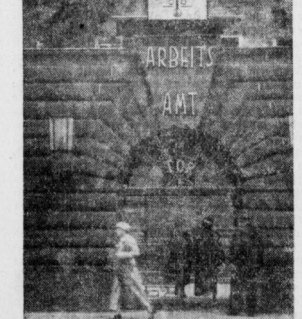
Ein originelles „Arbeitslosen-Thermometer“ am Arbeitsamt in Düsseldorf zeigt allen Vorübergehenden, wie die Arbeitslosenziffer immer weiter sinkt.