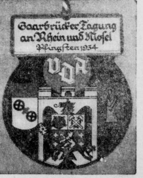
Festabzeichen für die Pfingsttagung in VDA. Die Teilnehmer an der zu Pfingsten in Mainz und Trier stattfindenden großen Tagung des Volksbundes für das Deutschland im Ausland werden diese Festabzeichen tragen. Die Tagung sollte ursprünglich in Saarbrücken stattfinden.

Herr von Ribbentrop hatte am Sonnabend noch eine kurze Unterredung mit Wendler und kehrte dann im Flugzeug nach Berlin zurück. Der Leiter der Pressekonferenz trat zu Pressevertretern, er möchte betonen, daß er eine engerer Zusammenarbeit zwischen den Nationen erwarte.