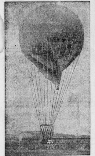
Der Unglücksballon „Bartsch von Siegfried“.