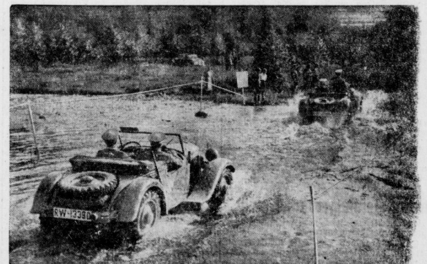
Examen im Harz auf Biegen und Brechen. Teilnehmer vom Kraftfahrversuchsstab Döberitz-Elgrund passieren den Lauterbach.