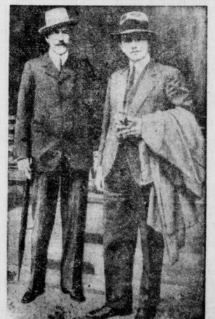
Erzherzog Eugen und Erzherzog Otto.

Die Flieger Bomb und Sabelli, die in Toledo aufgestiegen waren, um ihr Endziel dort zu erreichen, mußten in der Nähe von Souleia in England wiederum notlanden. Nach Weibung des Motorfadens flogen Bomb und Sabelli weiter, wo sie im vergangenen Tages eintrafen.