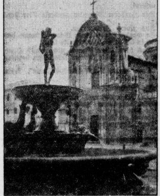
Die Hauptstadt der Ibexen.