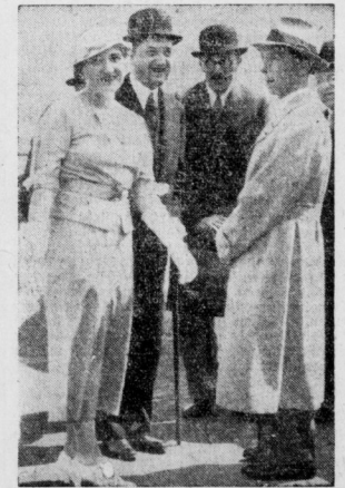
Reichsminister Goebbels flog nach Warschau. Dr. Goebbels mit dem polnischen Gesandten.