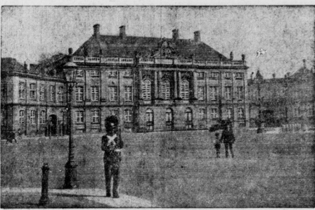
Kopenhagen: Schloss Amalienborg

Die sommerlichen Festspiele des Harzer Bergtheaters, der „Strahlen Bühne“ auf dem Seehausberg bei Zschale, beginnen in diesem Jahre am 30. Juni und enden am 31. August. Und dieser schon 1903 als erstes deutsches Landtheater gegründete Bühnen werden „Die Räuber“, „Wie ergötzt einen“, „Die Kreutzfahrer“, „Ein Sommerdrama“ mit der Musik von Busch am 17. Juli, „Hänsel“, „Die Hingelosen“ und „Wem der Fährte“ aufgeführt. Die Spielzeitung liegt in den Händen von Heinrich Kreus, Halle.