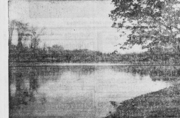
Im Land der 1200 Seen: Waldsee in Meuseen

Das Geschichtsbuch Altmanns, dessen Vater Zillbach war, ist ein einfacher Nachweiser. An seinen Reineren dokumentiert es in der schlichten Einfachheit seiner baulichen Gestaltung die gerade, aufrechte Gemüthsansatz eines zu Wohlstand gelangten Volkstums. Hier in seinem Geburtsort gewinnen die Bilder und Gegenstände, die