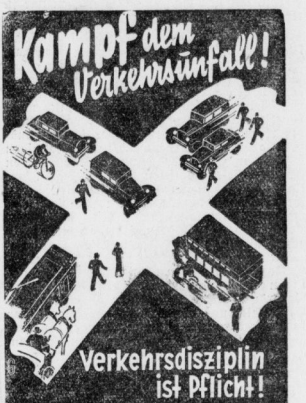
Verkehrsdziplin ist Pflicht!

„Mitteldeutsche Funkwochenschau.“ „Mitteldeutsche Funkwochenschau.“ „Mitteldeutsche Funkwochenschau.“