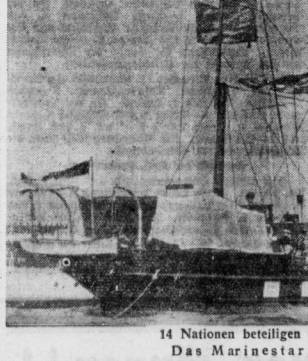
14 Nationen beteiligen sich an der Kieler Woche. Das Marinearschiff „Udine“.

Die Teilnehmer sind: ... Leichtathleten am Start.