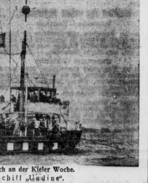
14 Nationen beteiligen sich an der Kieler Woche. Das Marinearschiff „Udine“.

Die Teilnehmer sind: ... Trauerfeier für den abgestorbenen Vitterfelder Segelflieger.