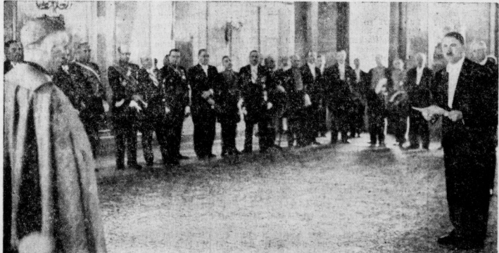
Der Führer und Reichskanzler empfängt das Diplomatische Korps im Reichspräsidentenpalais.

Wie, Deutschland hätte sich durch die französisch-italienische Einigung einmischen und beunruhigt? Dazu ist gar kein Anlaß vorhanden, beachtlich die englische Presse zu verheeren, bevor man von Berlin ein Wort gesagt wurde. Wer denkt da nicht an das französische Sprichwort Qui secusse, accuse! Auch dem können, der von den Fingern ungeschützt wird, geschicklich in nichts Weses. Im Gegenteil, man bringt ihn in den Zoo, wo er seine Ruhe und seine geregelte Mahlzeit hat. Was will er denn eigentlich mehr? Dient man so nicht seinem Wohl im allgemeinen und dem Frieden in besonderer Hinsicht und allen seine Schuld, wenn er mit seinem Nebenbarnen Schicksal nicht verbinden will. England ist erhoht darüber. Welche Unandbarkeit! Und überhaupt, es gibt keine deutsch-feindliche Front, kein Menageriebeißer hat feindliche Gedanken gegen den mächtigen Herr hinterher. Zwar meint Ferns Chronicle, die Beziehungen zwischen Italien und Deutschland seien noch nicht so schlecht gewesen und die Beziehungen zwischen