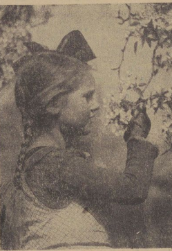
Frühling Silber: Große.

Betriebe, die sich sowohl mit den Männern als auch den Frauen am Sportappell beteiligen wollen, müssen die Voranmeldungen getrennt nach Männern und Frauen abgeben. Zum Schluß ist noch einmal erwähnt, daß dieser Sportappell offen ist für alle deutschen Betriebe und Teilnahmeberechtigt sind Männer über 18 Jahre und Frauen ab 21 Jahre. Fernerhin werden die teilnehmenden Betriebe in 3 Betriebsklassen eingeteilt, und zwar je nach Anzahl der teilnahmeberechtigten Beschäftigten.