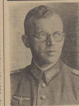
Der Inspektor der Wehrmachtsnachrichtenverbindungen im Oberkommando der Wehrmacht, Generalmajor Fellgiebel, erhielt von Generalfeldmarschall Göring den Auftrag, die technischen Nachrichtenmittel zu vereinheitlichen.