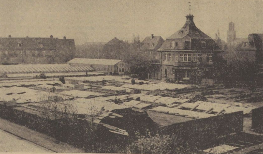
Siehe den Aufsatz, den wir in der gleichen Nummer auf Seite 7 veröffentlicht haben.