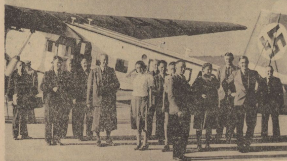
Unsere Maschine, die „M 20“, mit der unsere Sieger eine Stunde lang über die Heimat flogen.

Unter Flugpiloten hatte eine der vorbildlichsten Lösungen eingelangt, die uns mit zur Bewerhung