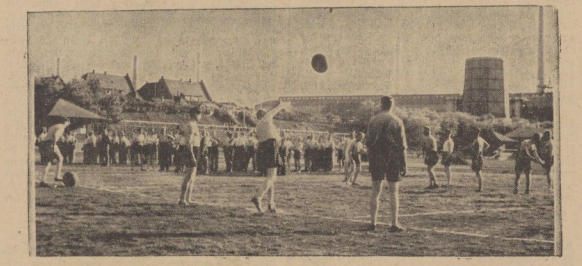
Gleich nach dem Appell begann der Wettkampfsport auf dem Stadion zu Leuna.

Wichtigste Teil der Sportveranstaltung war die Wettkämpfer des Orts an den Führer. Im 1930 Wettkämpfer des Orts an den Führer. Im 1930 Wettkämpfer des Orts an den Führer.