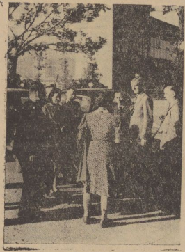
Ankunft auf dem Flughafen.

Die erste Veranstaltung mit den Siegern aus unserem Preisauschreiben: Sehn begehrte Fluggäste sahen die Heimat aus der Vogelschau