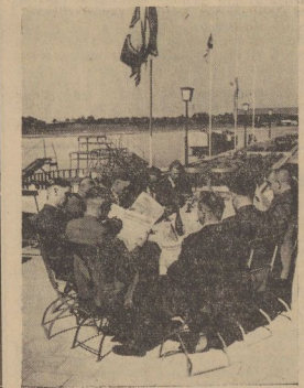
Eben trat die „Merseburger Zeitung“ ein.

Das war das besonders Schöne an diesem von herrlichem Wetter begünstigten Tag, daß sie alle, die sich zuvor nicht kannten, bald zu einer herzlichen Gemeinschaft untereinander gekommen sind, die auch für uns eine Befähigung des feierlichen Tages für unser Preisauschreiben war. Wir hatten ja alle Freunde unserer schönen Heimat zur Teilnahme aufgefordert, und die Liebe zur Heimat, nicht allein die Aussicht auf die zur Verfügung gestellten Preise, hatte die Teilnehmer bewegt, über die ganze Strecke unsere treuen Freunde zu bleiben, wenn auch manchmal die Schwierigkeiten allzu groß und teuer unüberwindlich schienen. Als wir uns am Morgen in unserer Verlagsbühne in Merseburg mit unseren Gästen trafen und sie durch unseren