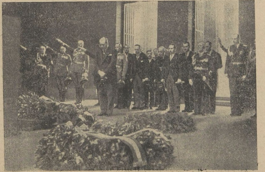
Der bulgarische Ministerpräsident am Ehrenmal Unter den Linden

Im polnischen Staatsgesetzblatt ist, wie der „Prinzliche Kurier“ meldet, das Gesetz über den Kriegszustand veröffentlicht. Nach Artikel 1 ordnet der Staatspräsident für das ganze Staatsgebiet oder Teile desselben auf Antrag des Ministerrates die Einführung des Kriegszustandes an. Mit der Einführung des Kriegszustandes werden alle gesetzlichen Bestimmungen über die bürgerlichen Rechte und Freiheiten aufgehoben. Die Starosten (Landräte) können die Internierung oder polizeiliche Überwachung bis zur Dauer von 3 Monaten, die Weisungen auf eine noch längere Zeit verfügen. Andere Bestimmungen des Gesetzes beziehen sich auf die Bestimmungen des Landratspräsidenten und des Ministerpräsidenten für die öffentliche Gesundheitspflege. Wo insolge von Kriegshandlungen die Zivilbevölkerung nicht amtieret, gehen deren Rechte auf das Militär über. Der Ministerrat kann überdies während des Kriegszustandes das Stimmrecht einführen, wobei im Schnellverfahren die sonst geltenden gesetzlichen Bestimmungen über Verhör usw. nicht eingehalten zu werden brauchen. Mit der Einführung des Kriegszustandes wird der vorher eventuell eingetretene Ausnahmezustand aufgehoben.